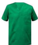
58 Verde Quirúrgico